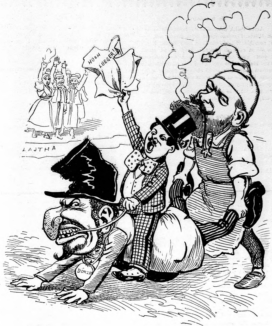
čili: z módy vyndené liberálne panovanie tiahne sa von z domu obecného.