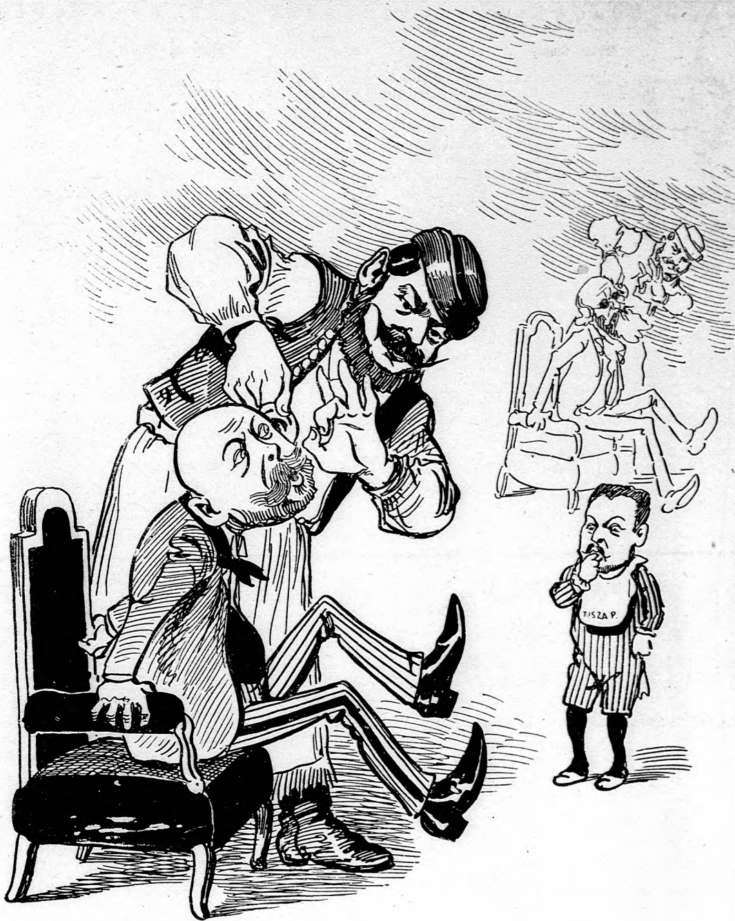
Všeobecná mienka. Keď este aj mimo cesti sa ho tak pridržajú.

Keď stolec ministerský naozaj je tak biedny, jako ho Pišta Tisa menuval!?!