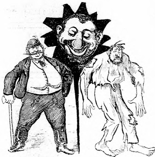
Vehod a východ z Ťs-Budaváru.