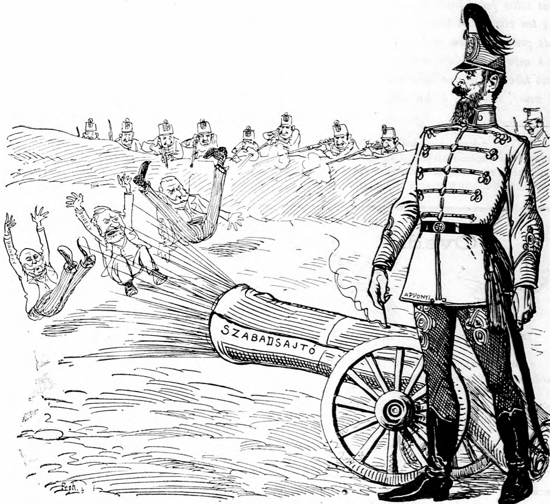
Toto je ten prvý honvédskeý delostrelec, ktorý trafil centrum.