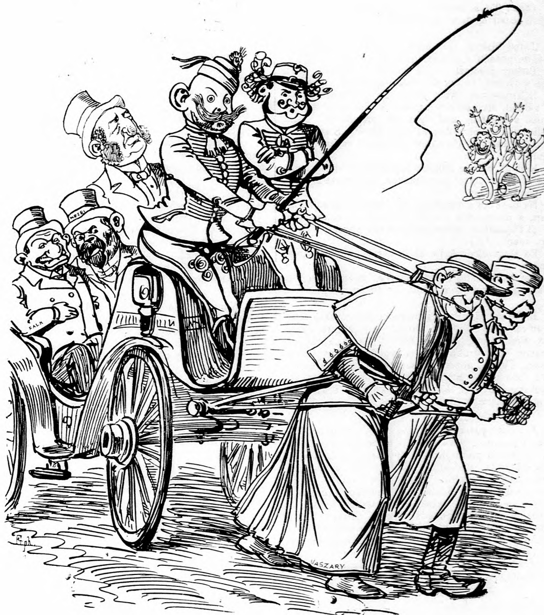
A akú ju chce vynútiť khóšer-liberálnosť.