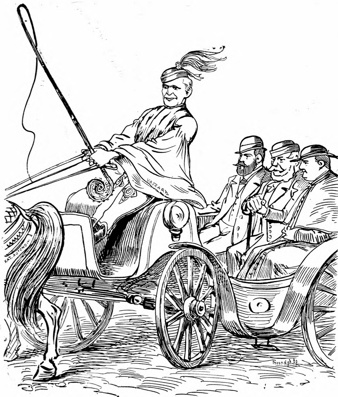
Ako by si ju katolícka verejná mienka žiadala.