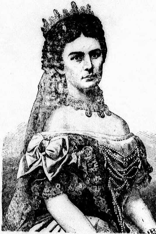
Erzsébet királyné szül. 1837. dec. 24. — megh. 1898. szept. 10.

Mellette állott a legnagyobb csapás súlyában. De midőn urunk, királyunk kezdé visszanyerni lelkének egyen súlyát, akkor törött meg az Ő testének, lelkének ereje. Bolygó csillag lón egyetlen fiának szelleme körül.