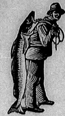
Az emulsió vásárlásánál a SCOTT-féle módszer végigyet — a halászt — kérjük figyelembe venni.