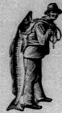
Az emulsió vásárlásánál a SCOTT-féle módszer vejeget a halasat kérjük figyelembe venni.

meggátolja, a testet, a gyermek húsát egészségessé, erőssé fejleszti a SCOTT-féle Emulsió. Ez a szer a legjobb gyógyító és erősítő táplálék gyermekek részére, és az Ön gyermekét is meggyógyítja, mint ahogy sok ezer gyermek fejlődését elősegítette a szer használata által. A gyermekeknek életkedvet kölcsönöz. Ha betegeskedik a gyermek, úgy azonnal adasék neki