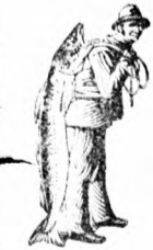
Az Emulsió a Scott-féle Emulsióval készült. A baloldali képen látható a Scott-féle Emulsióval készült. A baloldali képen látható a Scott-féle Emulsióval készült.

alakjában élvezik, amely az összes erősítő szerek között a legkiválóbb.