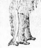
Az Emulsió valószínűleg a SCOTT-féle - egyszer védjegyet - a halász - kérik figyelembe venni.

Orvosok és bábák az egész föld kerekén állandóan ajánlják a