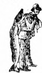
Az Emulsió vásárlásánál a SCOTT-féle módszer védjéjét — a halászt — kérjük figyelembe venni.