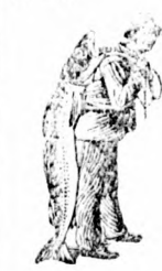
Az Emulsió vásárlásánál a SCOTT-féle módszer védjegyét — a halászt — kérjük figyelembe venni.

a legkomolyabb betegségeknek biztosan elejét veszi a SCOTT-féle EMULSIÓ . Az egészség gyors visszaszerzése meglepi mindazokat, a kik először tesznek kísérletet a