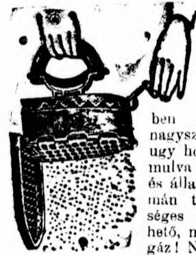
Aranyéremmel kitüntetve Budapest, 1911.

A feneke nyitott, miáltal a hamu azonnal könnyen kihull. Minden más vasalóval szemben az új Vulkán nagyszerű légvonat, úgy hogy a cycle perc múlva használható és állandóan egyformán tüst. Községes fűvel fűthető, megves szén-gáz! Nem kell fújtatni, nem kell lóbálni, tehát csodáosan tiszta és gyors vasalás! A uhs kiégetése vagy a kezek megegetése kizárva. Világzabadalom! Ára szabadalmazott kézzel együtt: esiszolva 6. 50 K. nikkelezve 7. 50 K. elpusztíthatlanul. zománcozva 8. 50 K. Kapható minden vaskereskedésben és háztartási üzletben. Gyár és világzabadalom-tulajdonos