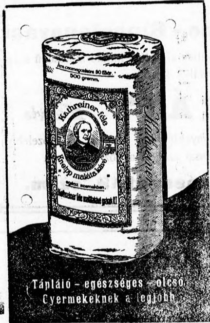
Tápláló - egészséges - olcsó. Csermeknek a legjobb

Szabadka husfogyasztása. Szabadka város közönsége az elmúlt évben a vár. állatorvos jelentése szerint a következő husmennyiséget fogyasztotta el: 99 bika, 198 ökör, 92 üsző, 157 tinó, 3496 borju, 3 bivaly, 18,403 öreg juh, 4466 bárány, 1 kecske, 16,715 disznó, 87 malac, összesen 60,000 állat, ami körülbelül 5 millió kg. husnak felel meg. E kimutatás azonban csak a vágóhídon levágott állatokról számol be, már pedig a magánosok által levágott állatok száma is körülbelül annyira tehető, mint a fent jelzett hivatalos szám. Hiszen Szabadkán majd minden háznál legalább 2-3 sertést vágnak le évenként, nem számítva a nagy lakodalom alkalmával levágott állatokat.