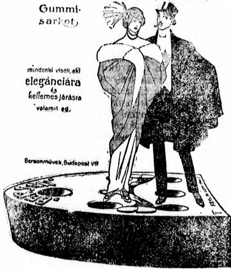
Bersonművek, Budapest VIII

mindenki viseli, aki elegánciára és kellemes járásra valamit es.