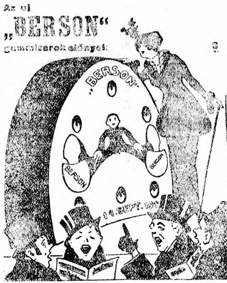
rendkívül tartós, kiválóan ruganyos formája miatt