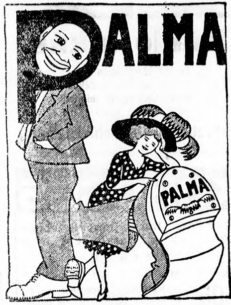
Felelős szerkesztő: Zanbauer Ágoston. Laptulajdonos az ujvidéki függetlenségi és 48-as párt.

Még néhány szót a tollas kalap kérdéséhez. Természetesen örömmel csatlakozunk mi is azokhoz, akik meg akarják védeni a nemesebb madarakat a pusztulástól és hadat üzennek a tollas kalapnak. Csak arra akarunk figyelmeztetni, hogy nem minden tollász kerül valamely madárnak az életébe. A legtöbb esetben „csinált” dolog a toll, vagyis a házimadaraink tollából van preparálva, ragasztva, festve stb. Ilyennel pedig miért ne vigyünk egy kis változást kalapjaink díszébe?