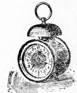
Kakas ébresztő óra, diszített számlappal, kiváló jó mű- vel, 18 cm. magas 2 frt 20 kr.

Minden tárgy a kir. főpénzverdehivatal által megvizsgálva és bélyegezve. Kitüntette állami és aranyérmekkel. Több ezer elismerő levél birtokomban van. Nagy képes árjegyzék ingyen és bérmentve küldeték.