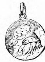
Szent Antal amu- lett, színes tűz- márcos aranyozott ezüstből 2 frt. Ugyanaz aranyból 3 frt 50 kr.