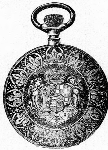
Kitünő járásu tula horgonyremontoir óra, aranyozott szegélyvel és Magyar- ország domborművű ezimérel 9 frt.