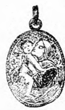
Rafael Madonna amulett