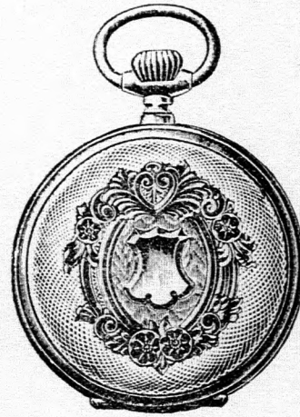
Valódi kettős fedelű ezüst remon- toir óra, igen jó járásu szerkezet- tel, pompásan vésett és aranyozott keretű tokban, ára 16 korona. Hasonló aranyozott keret nélkül 12 korona.