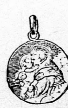
Szent Antal amulett, színes tűzö-mánczu aranyozott ezüstből 2 frt. Ugyanaz aranyból 3 frt 50 kr.