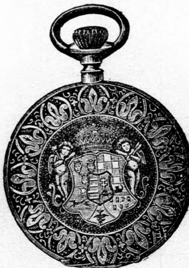
Kitűnő járásu tula horgonyremontoir óra, aranyozott szegélyllyel és Magyarország domborművű czimerével 9 frt.