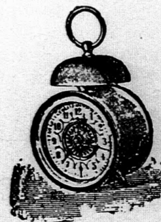
Kakas-ébresztő óra, díszített számlappal, kiváló jó művel, 18 cm. magas 2 frt 20 kr.

Minden tárgy a kir. főpénzverdehivatal által megvizsgálva és bélyegezve.