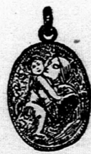
Rafael Madonna amulett színes, tűzö-márczos aranyozott ezüstből, oxidálva 1 frt 50 kr. Ugyanaz aranyból 3 frt.