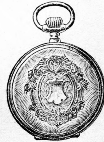
Valódi kettős fedelű ezüst remontoir óra, igen jó járásu szerkezetű, pompásan vésett 64 aranyozott keretű tokban, ára 16 korona. Hasonló aranyozott keret nélkül 12 korona.