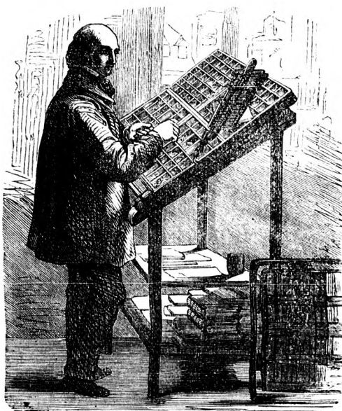
Szedő a betűszekrény előtt.

A kéziratnak a nyomdába érkezése után a „szedő“, mint képünk mutatja, a betűszekrény elé áll, s míg szemé az elébe