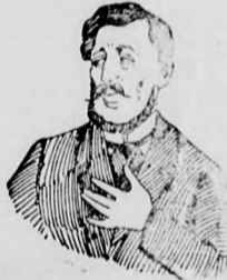
Megfojt ez az átkozott köhögés!