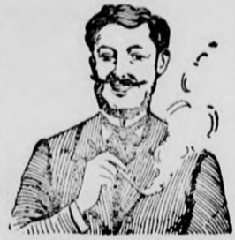
Egger-mellpasztillája csakhamar meggyógyított!

„NADOR“ gyógyszer-tár BUDAPEST, VI., Váci-körút 17.