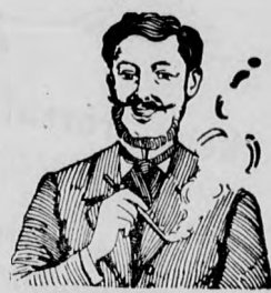
Egger-mellpasztillája csakhamar meggyógyított!

az étvágyat nem rontják és kitűnő ízűek. — Doboza 1 és 2 korona. Própadohoz 50 fillér. Fő- és szétküldési raktár: