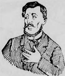
Megfojt ez az átkozott köhögés!

és elnyálgasodás ellen gyors és biztos hatásnak