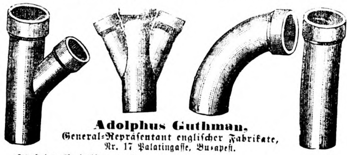
Adolphus Guthman , General-Representant englischer Fabrikate, Nr. 17 Palatingasse, Budapest.