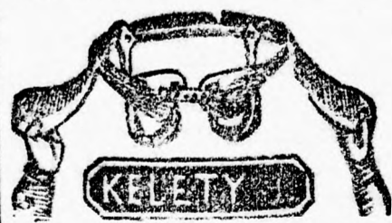
Herren- u. Damenbruchband mit Bruch-Schützer

gewebt aus Hirschleder und vulkanisiertem Kautschuk. Preis von 40 Kr. bis 3 fl. Für Herren sehr empfehlens- werth. Viel Gebenden. Heilens- wert und der Arbeiterklasse unbedingt nöthig. Schützt gegen jeden Unterleibs- schaden.