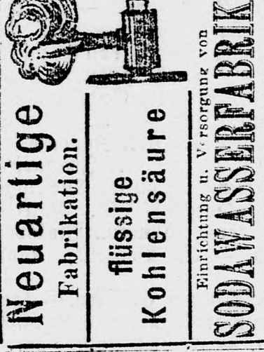
Neuartige Flüssige Kohlensäure Soda-Wasserfabriken