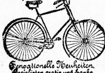
Spezielle Reparaturen. Einziehen gratis und franco.

(Gegründet im Jahre 1834) W. Hochfinger & Söhne in Eszkaturn (Ungarn, Murtin) versehen einen echten, hochfeinen