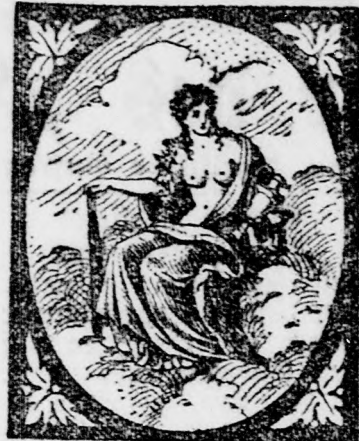
Hebe- oder Jugendseife

Der feinste Anzug, der feinste Ueberzieher, der beste Winterroch von fl. 14 bis fl. 17 nach Maß aus echt englischen und französischen Stoffen, welche aus Konsummassen herrühren, sind bei mir zu haben. Gleichzeitg werden von Herrschaften abgelegte Herrenkleider zu den billigsten Preisen verkauft. Kleider werden auch leihweise verabfolgt. B. Grossmann, Budapest, IV., Hatvani-utca 13. I. emelet.