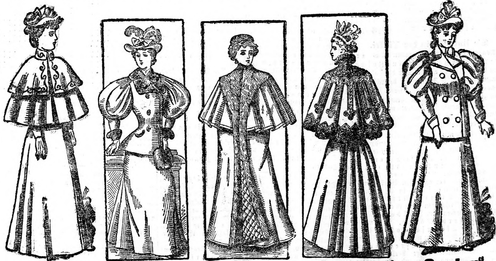
„Carola“ fl. 3.— „Ophelia“ fl. 10.— „Diana“ fl. 20.— „Fortuna“ fl. 12.— „Gentry“ fl. 7.—

Neuheiten für Herbst- und Winter-Saison 1895-96.