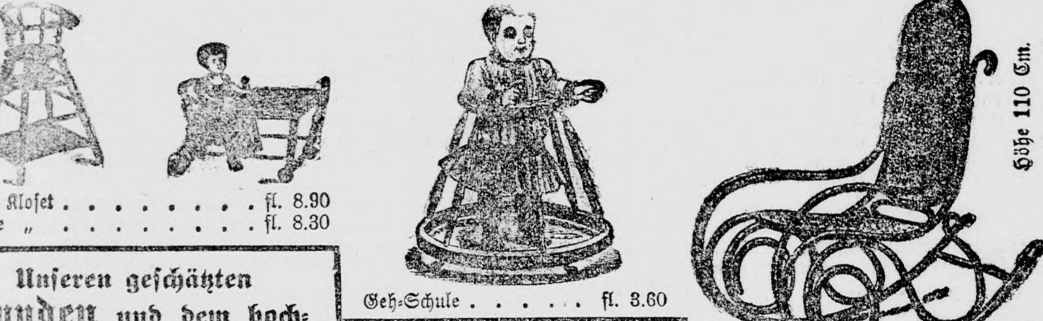
Mit Klotz . . . . . fl. 8.90 ohne . . . . . fl. 8.30 Geh-Schule . . . . . fl. 3.60

Preis verpackt . . . . . fl. 14.50 mit einer passenden feinen Decke aus Peluche in jeder Farbe, Größe 50/180 Cm. . . . . fl. 19.50