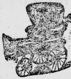
Schutzmarke am Boden des Wagens sich befindet.