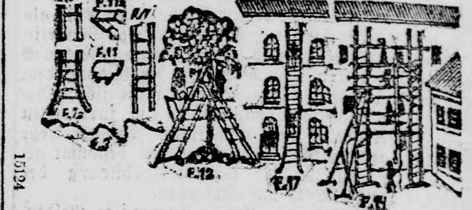
Fig. 7 veranschaulicht eine Sektion. Dieselbe ist 210 Cm. lang und 55 Cm. breit. Preis aus Hartholz (Buche) Kr. 7.60. Aus solchen Sektionsleitern können in wenigen Minuten für alle Industriezweige und für Deponomen, Bau- u. Maurermeister, laut Fig. 12 u. 17 Stieh-, Feuer- u. Gartenleitern, laut Fig. 14 transportable Leiter-Gerüste bis zu 5 Stockwerke Höhe leicht und überraschend schnell aufgestellt werden.