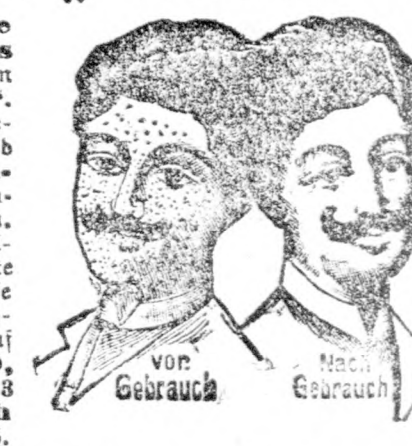
Vor Gebrauch Nach Gebrauch

Fragen Sie Ihren Arzt, ob „Feeolin“ nicht das beste Kosmetikum für Haut, Haare und Zähne ist. Das unreinste Gesicht u. die hässlichsten Hände erlangen sofort aristokratische Feinheit und Form durch Benützung von „Feeolin“. „Feeolin“ ist eine aus 42 der edelsten u. feinsten Kräuter hergestellte englische Seife. Wir garantieren, daß ferner Rauheit und Falten des Gesichtes, Mitesser, Wimmerin, Nasenröthe etc. nach Gebrauch von „Feeolin“ spurlos verschwinden. „Feeolin“ ist das beste Kopfhaarreinigungsmittel, Kopfhautpflege u. Haarverjüngungsmittel, verhindert das Ausfallen der Haare, Kahlköpfigkeit und Kopfschmerzen. „Feeolin“ ist auch das natürlichste u. beste Zahnpulver. Wer „Feeolin“ regelmäßig anstatt Seife benützt, bleibt jung und schön. Wir verpflichten uns, das Geld sofort zurückzuerstatten, wenn man mit „Feeolin“ nicht vollauf zufrieden ist. Preis per Stück K. 1, 3 Stück K. 2.50, 6 Stück K. 4.12 Stück K. 7. Porto bei 1 Stück 20 H., von 3 Stück aufwärts 60 H. Nachnahme 40 H. mehr. Versandt durch das Generaidepot v. M. Feith, Wien, VI., Mariahilferstr. 45.