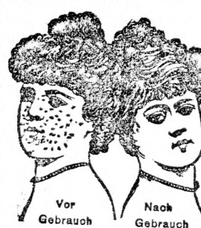
Vor Gebrauch Nach Gebrauch

Fragen Sie Ihren Arzt, ob „Feeolin“ nicht das beste Kosmetikum für Haut, Haare und Zähne ist. Das unreinste Gesicht u. die hässlichsten Hände erlangen sofort aristokratische Feinheit und Form durch Benützung von „Feeolin“. „Feeolin“ ist eine aus 42 der edelsten u. feinsten Kräuter hergestellte englische Seife. Wir garantieren, daß ferner Rauheit und Falten des Gesichtes, Mitesser, Wimmerin, Nasenröthe etc. nach Gebrauch von „Feeolin“ spurlos verschwinden. „Feeolin“ ist das beste Kopfhaarreinigungsmittel, Kopfhautpflege u. Haarverjüngungsmittel, verhindert das Ausfallen der Haare, Kahlköpfigkeit und Kopfschmerzen. „Feeolin“ ist auch das natürlichste u. beste Zahnpulver. Wer „Feeolin“ regelmäßig anstatt Seife benützt, bleibt jung und schön. Wir verpflichten uns, das Geld sofort zurückzuerstatten, wenn man mit „Feeolin“ nicht vollauf zufrieden ist. Preis per Stück K. 1, 3 Stück K. 2.50, 6 Stück K. 4.12 Stück K. 7. Porto bei 1 Stück 20 H., von 3 Stück aufwärts 60 H. Nachnahme 40 H. mehr. Versandt durch das Generaidepot v. M. Feith, Wien, VI., Mariahilferstr. 45.