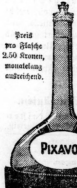
Preis pro Flasche 2.50 Kronen, monatelang ausreichend.

daß wir auf die außerordentliche Wohlthat, die man seinem Haar durch regelmäßige Waschungen mit Pixavon erweisen kann, aufmerksam machten. Der enorme gesundheitliche Werth der Kopf- und Haarwäsche mit Pixavon ist von allen, die es versucht haben, schnell erkannt worden. Wer sich einmal daran gewöhnt hat, Kopfhaut und Haar regelmäßig die Woche einmal mit Pixavon zu waschen, weiß, daß es kein besseres Mittel gibt, um sein Haar gesund und kräftig zu erhalten. Pixavon reinigt nicht nur, sondern wirkt durch seinen Theergehalt direkt anregend auf den Haarboden. Es ist daher als das thatächlich beste Mittel zur Pflege der Kopfhaut und zur Kräftigung der Haare anzusprechen.