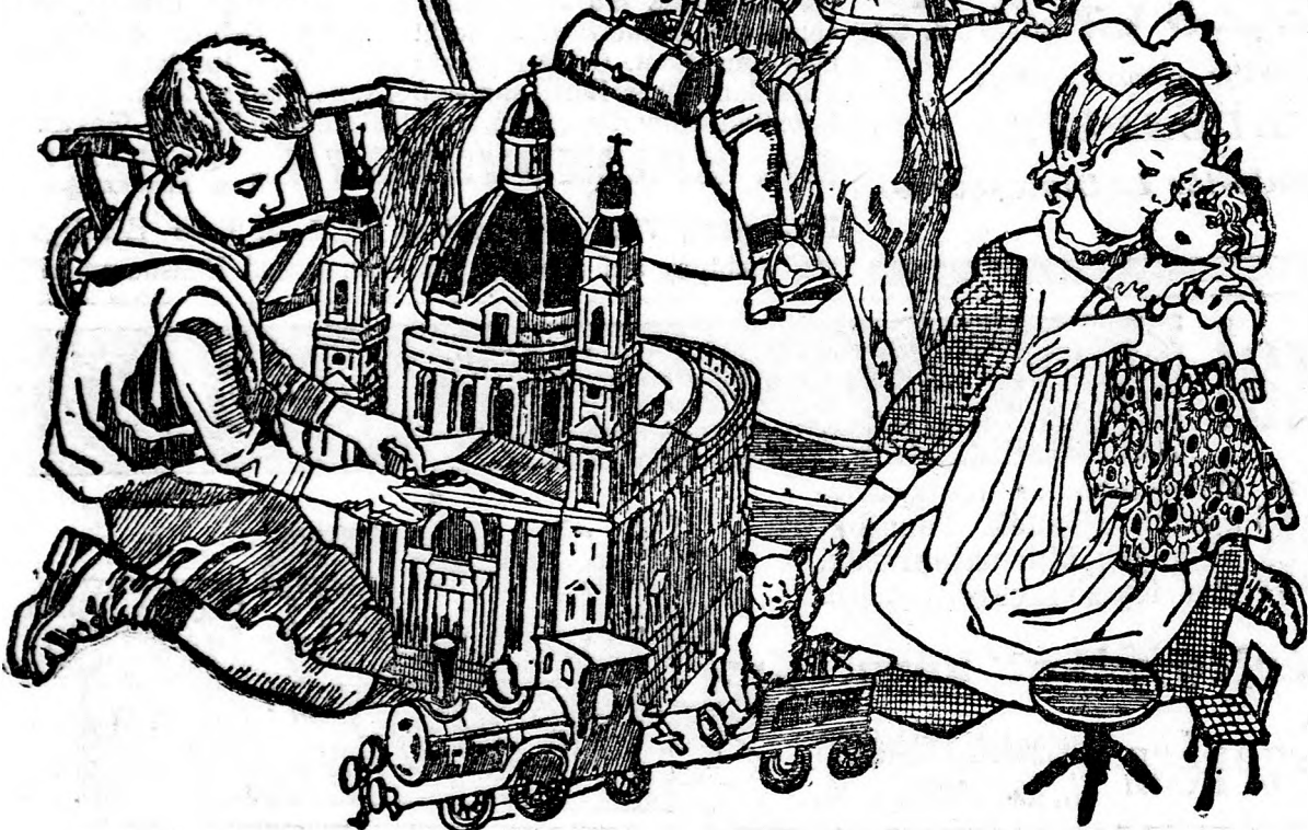
A LIPOTVÁROSI BAZILIKA FŐBEJÁRATAVAL SZEMBEN.

Vidéki megrendelések a legpontosabban eszközöltetnek.