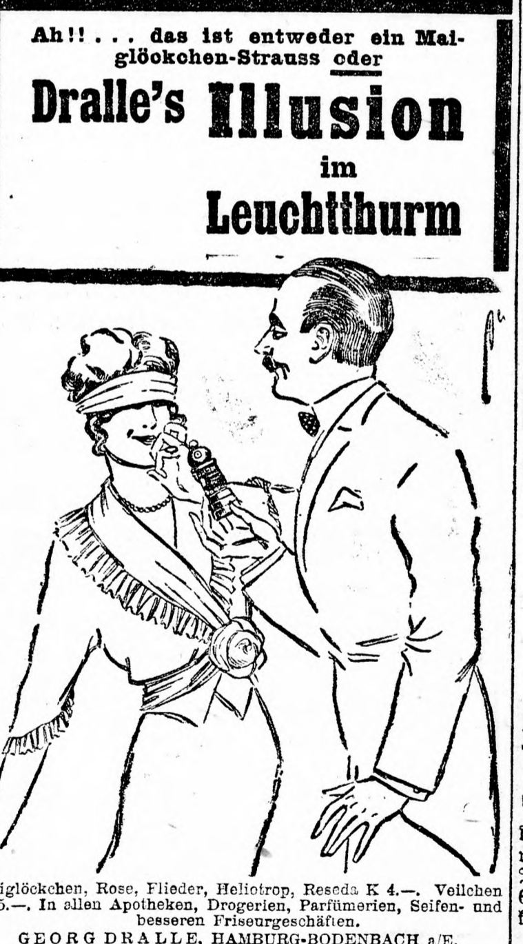
Malglockchen, Rose, Flieder, Heliotrop, Reseda K 4.—, Veilchen K 5.—. In allen Apotheken, Drogerien, Parfümerien, Seifen- und besseren Friseurgeschäften. GEORG DRALLE, HAMBURG-BODENBACH a/E.

Ah! . . . das ist entweder ein Malglockchen-Strauss oder Dralle's Illusion im Leuchtturm