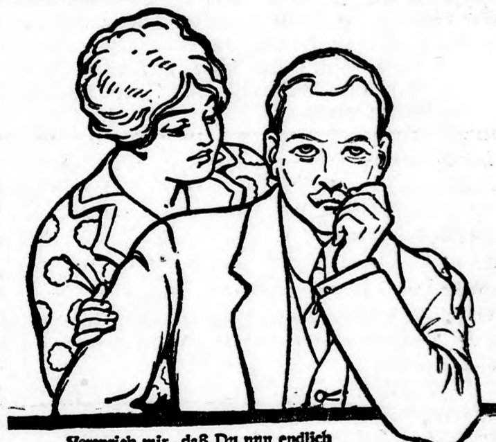
Verspricht mir, daß Du nun endlich Sanatogen nehmen wirst.

Hamburg, 7. Mai. Zuckermarkt. (Nachmittagsverehr.) Per 100 Kilogramm. — Tendenz: ruhig, per Mai M. 9.30, per Juni M. 9.40, per Juli M. 9.50, per August M. 9.60, per September