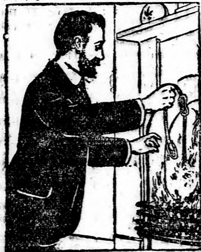
Setzen Sie Ihren Bruch und verbrennen Sie das Bruchband.

Alle die wichtigen Entdeckungen, die mit der Heilkunst im Zusammenhang stehen, sind nicht von Ärzten gemacht worden. Es gibt Ausnahmen, eine solche wurde von einem schaffinnigen und geschickten alten See-Kapitän — Kapitän Collings — gemacht. Nach- dem er selbst Jahre lang an einem doppelten Bruche gelitten hatte den die Ärzte als unheilbar erklärten, gab er sich nicht der Ver- zweiflung hin, sondern entschloß sich, alle seine Zeit und Energie darauf zu verwenden, selber ein Heilmittel zu erfinden. Nachdem