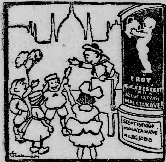
Egységünk megrontója, Idegességünk okozója a bakkávé. Le vele!!! Csak egy kávé az egészség a. Szent István malátakávé.

* Hanna Honthy, aus deren Hand wir unser heutiges Defameron-Feuilleton erhalten haben, ist das begabteste und liebenswürdigste Souverettalent der Budapester Operette. Sie wirkt erst seit drei Jahren ständig auf der hauptstädtischen Bühne und hat sich bereits so-