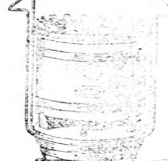
Petroleum-Kochofen mit Sicherheitsbrenner.