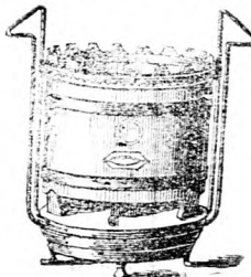
Petroleum-Kochofen mit Sicherheitsbrenner.