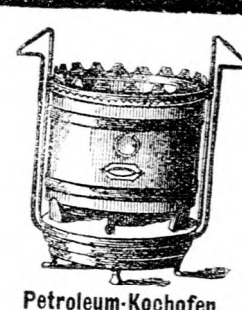
Petroleum-Kochofen mit Sicherheitsbrenner.