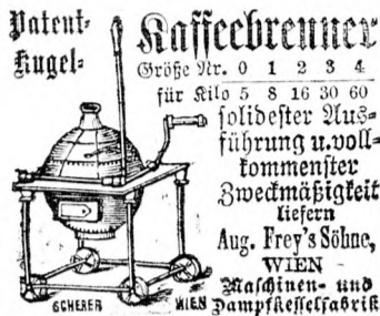
Größe Nr. 0 2 3 4 für 2 bis 3 5 10 20 30 40 vollster Ausfuhrung u. vollkommener Zweckmäßigkeit versehen Aug. Frey's Söhne, WIEN Maschinen- und Dampfmaschinenfabrik. 15-30 [402]