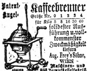
Patent-Kaffeebrenner Größe Nr. 0 1 2 3 4 für 2 bis 5 8 12 30 60 soldester Aus- führung u. voll- kommenster Zweckmäßigkeit Hefen Aug. Frey's Söhne, WIEN Graben- und Dampfkessel-Fabrik.

NB. Ankünfte und Rathschläge werden sofort und ge- wissenhaft ertheilt. (581) 5-8