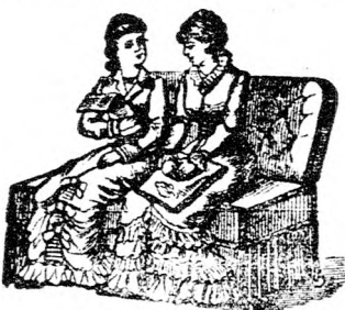
Als zwei Fauteuils

Patent für Oesterreich-Ungarn Nr. 17550 und 18857. Zu benützen am Tage als Sopha.