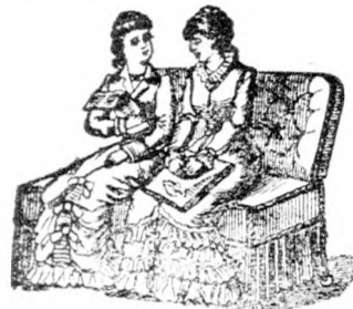
Als zwei Fauteuils

Patent für Oesterreich-Ungarn Nr. 17550 und 18857. Zu benützen am Tage als Sopha.