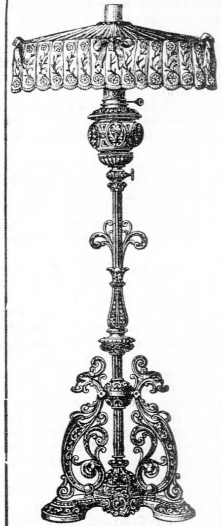
Ständer-Lampe mit Spitzenschirm.

Die Astral-Lampen können ihrer praktischen Form wegen in die verschiedensten Lampengestelle eingesetzt werden.