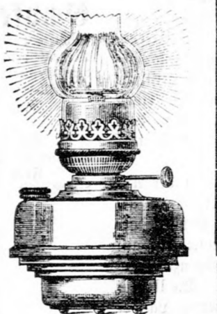
Astral-Lampen. Einsatz mit Brenner 20“ mit 58 Kerzen Lichtstärke 30“ „ 104 “

Niederlage: Budapest, V., Josefsplatz, Ecke Bad- u. Palatingasse.