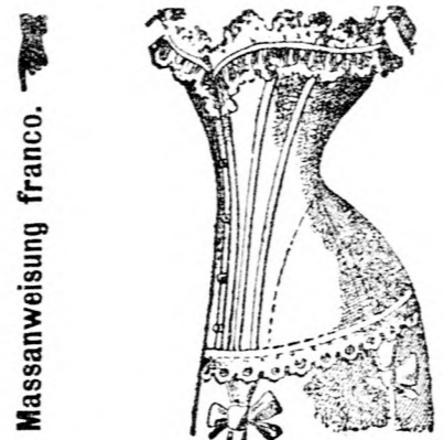
Corset Droit-devant nach neuesten Pariser Modellen.