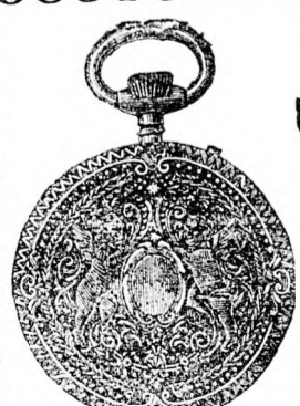
Nr. 190 C.