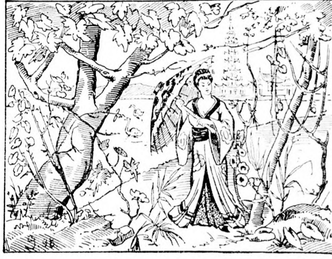
Wo ist der Geliebte Hanki Koo?

Die Suppe braucht nicht sehr lange zu kochen und wird dann durchs Sieb gegeben, die Milchnerstücke jedoch mittlerweise. Liebhaber von Nahrung werden auch den Kopf nicht verschmähen. S. S. 27.