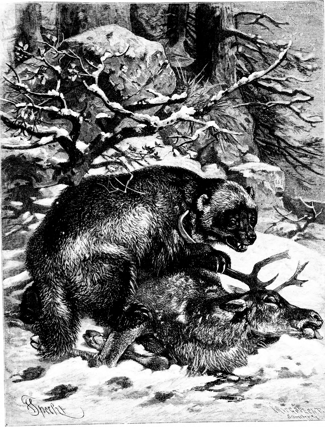
Der Bieftraß (Gulo borealis.) Von H. Specht. (Mit Text.)

Sie kämpfte mit einer Ohnmacht. Der Leutnant sah ihr Erblichen. Natürlich, eine angehende Schriftstellerin mußte Nerven haben, das gehörte mit zur Sache.