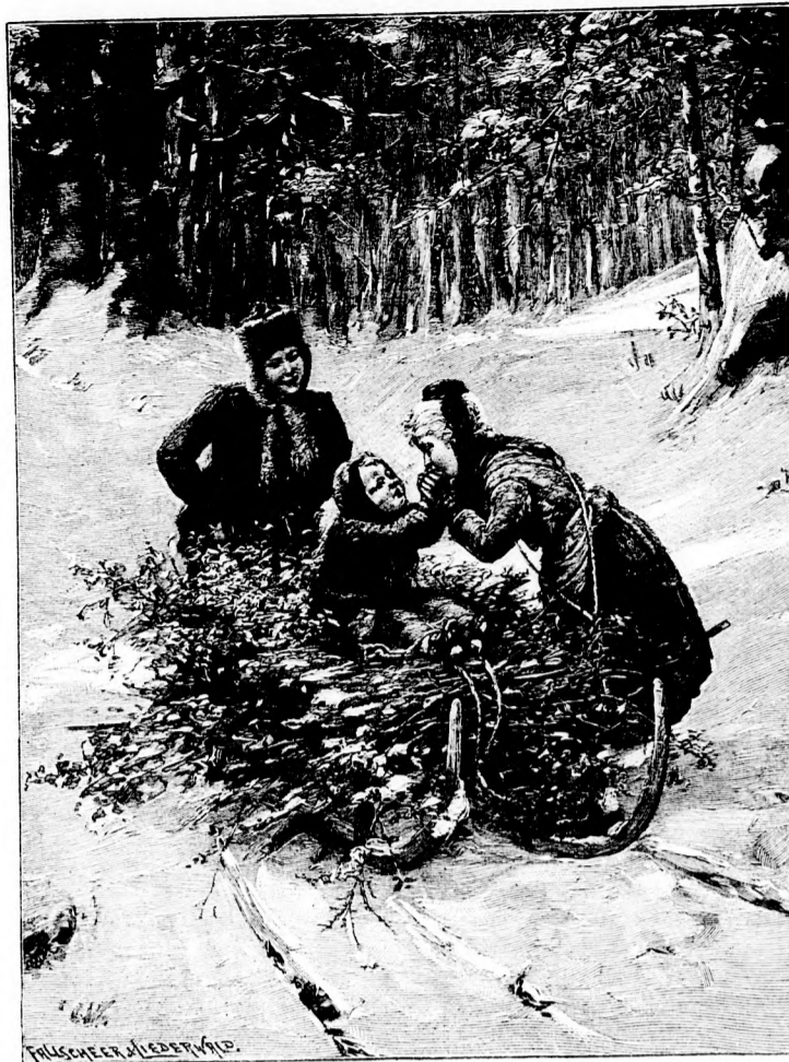
„Schwesterchen friert!“ Gemälde von L. Plume-Eisebert. (Mit Text.)

„Entzückend, großartig! Ich würde es sicher zum bevorstehenden Weihnachtsfest erwerben, selbst wenn ich es mit Geld abwägen müßte, und nun haben gnädige Frau gar die Güte gehabt, uns dieses reizende Werk zu schenken.“