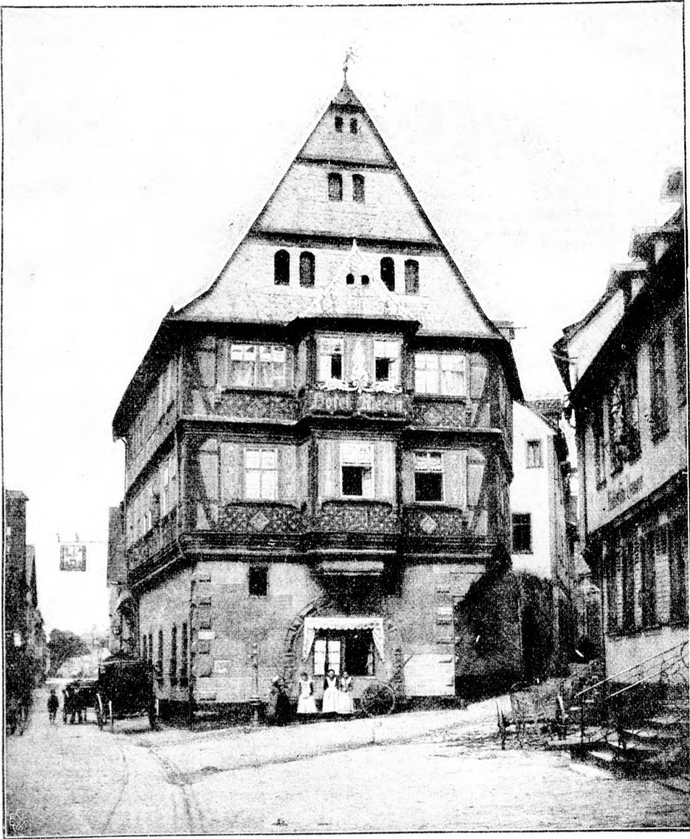
Hotel zum Riesen in Mittelnberg a. M., das älteste Gasthaus in Deutschland. (Mit Text.)

Das Ehepaar besaß nur einen Sohn, für dessen Erziehung keine Kosten gescheut wurden, denn die Eltern wollten hoch hinaus mit ihrem Einzigem: er sollte studieren und etwas Bedeutendes werden. Nun, der Waldemar hätte auch das Zeug dazu gehabt, denn er war aufgeweckt und lernte erstaunlich leicht.