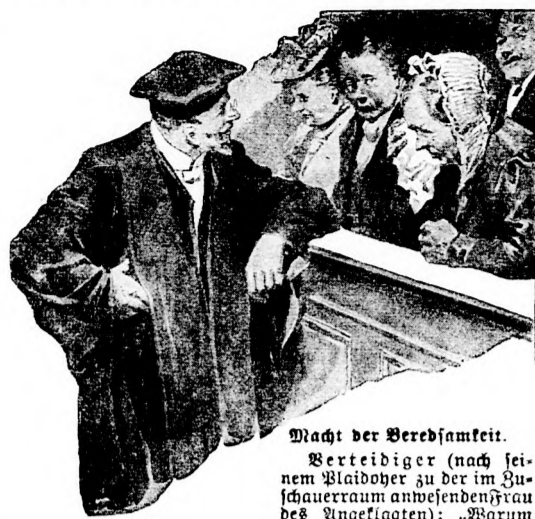
Macht der Verebbarkeit. Verteidiger (nach seinem Vaidhofer zu der im Zuschauerraum anwesenden Frau des Angeklagten): „Warum weinen Sie, liebe Frau?“

Ansicht aus Zürich. Vorstehend bieten wir eine sehr gelungene photographische Aufnahme aus dem schönen Zürich, die den Stadthausplatz mit dem neuen Stadthaus (in der Mitte) und dem neuen Hauptpostgebäude (links) zeigt. Die Kirche rechts ist die Frauenmünsterkirche, deren ältester Teil im 9. Jahrhundert von Ludwig dem Deutschen gestiftet wurde.