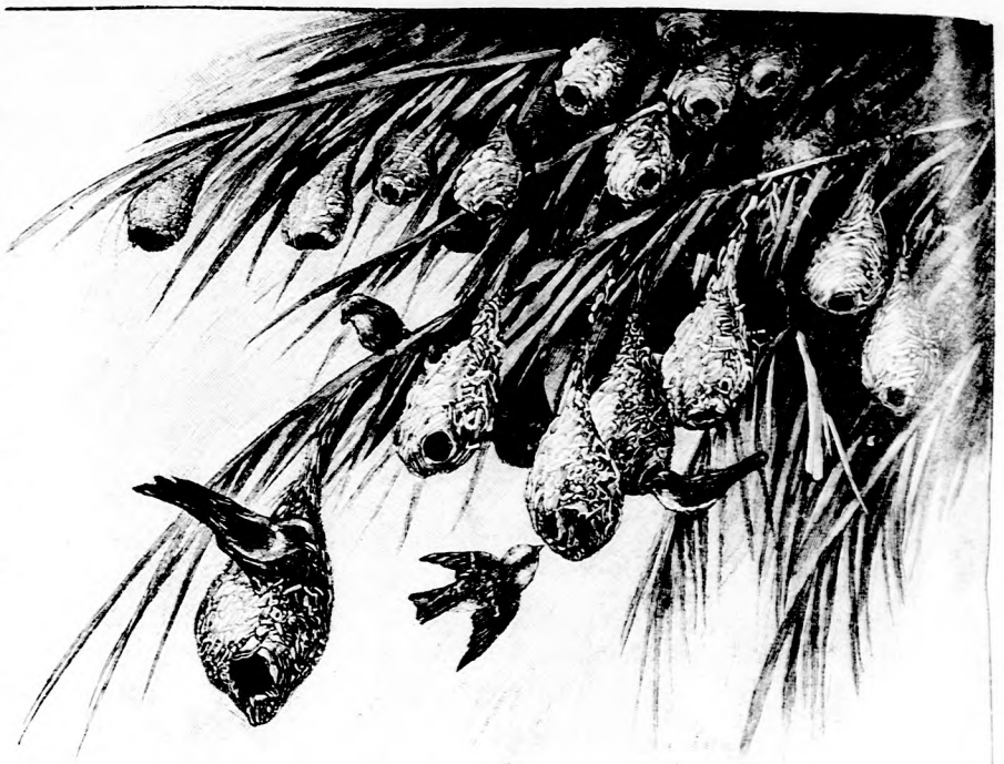
Neßter des Goldwebers (Hypphantornis galbula). (Mit Text.)

"Ja. Vor einem Augenblicke hat er mich verlassen."