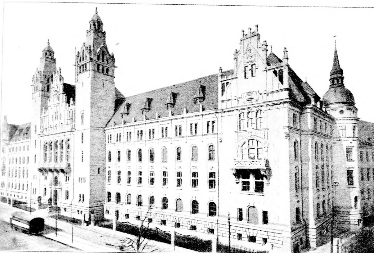
Der neue Justizpalast in Magdeburg (Provinz Sachsen). (Mit Text.)

trieben hatte, die konnte er nicht verschwinden machen. So ratlos er dem Steinchen gegenüber war, so ratlos war er auch dem Zettel gegenüber. Was hießen die geheimnisvollen Buchstaben: Dav. St. Grbd.? Die andere beschriebene Seite konnte er schon ergänzen: „o—hne Erbarmen dem Ge—richte.“