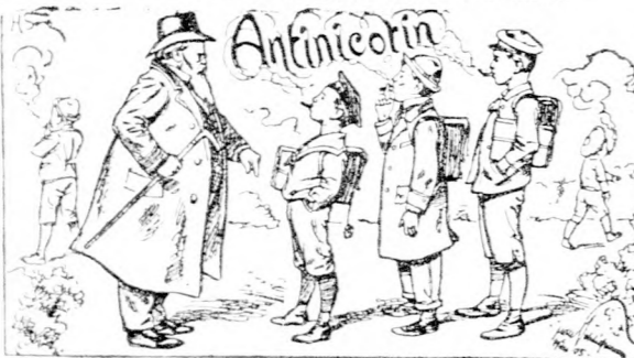
Fabrik: Wien, Piristengasse.

Waaas?!... Papa hat's erlaubt, es ist ja Jacobi's Antinocin-Cigaretten-Hülse.